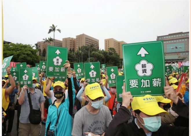
五一一大遊行，勞團要求加薪。