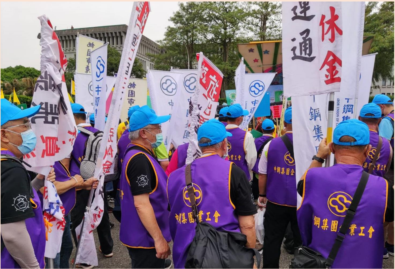
中運退休船員當天也參與遊行，為自身權益受損上街怒吼，呼籲中運公司別再忽視盡快出面解決