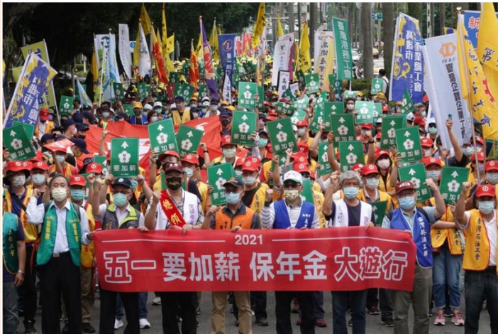
五一一大遊行，勞團要求薪保年金。

求政府應該儘速展開公眾對話，挽救年金危機，公教調薪及勞工年改的政策討論過程應該公開透明並納入工會代表，但蔡政府充耳不聞，逼得大家今天要千人齊向行政院遞交陳情。