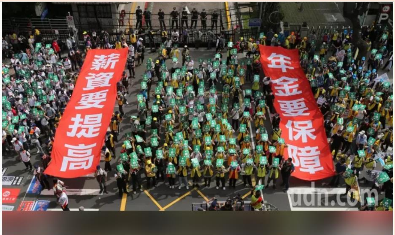
五一勞動節，數千名勞工在凱道集結走上街頭，要求政府正視勞工權益，遊行隊伍在立法院外拉起兩幅「薪資要提高、年金要保障」巨型布條，要求立法委員修法保障勞工調薪權益。